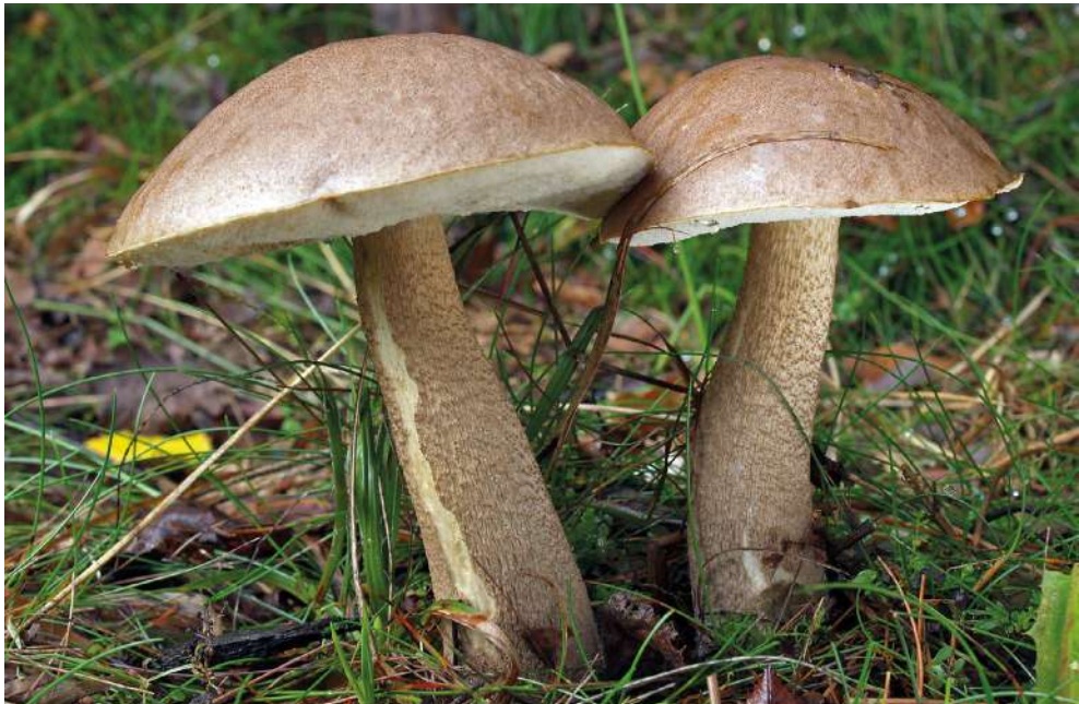
Abbildung 41: Gemeiner Birkenpilz ( Leccinum scabrum ).

18.9.2013, K, bei Betula pendula , 1000 m, T. Bernauer & M. Scholler / M. Scholler (KR-M-0037027); 27.8.2019, K, bei Betula sp., 900-1000 m, F. Popa (KR-M-0091198).