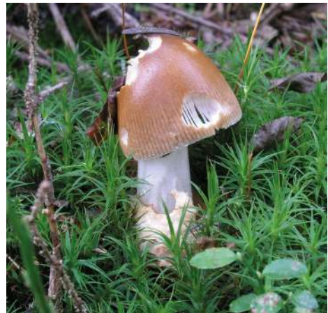
Abbildung 3: Rotbrauner Streifling ( Amanita fulva ).

Der Rotbraune Streifling ist eine häufige Art auf nährstoffarmen Böden. Mykorrhizapartner sind Laub- und Nadelgehölze. Im Untersuchungsgebiet waren es nur Nadelgehölze. Den Fruchtkörper in Abbildung 3 fanden wir neben Weiß-Tanne ( Abies alba ), Berg-Kiefer ( Pinus mugo ) und Fichte ( Picea abies ). Die Art gehört in die Wulstlingsverwandtschaft (Amanitaceae), jedoch fehlt bei den Scheidenstreiflingen der feste Ring am Stiel.