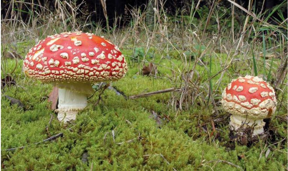
Abbildung 4: Fliegenpilz ( Amanita muscaria ).

Gattung Amanita . Die Mykorrhizapartner können Laub- und Nadelbäume sein. Der Hauptgiftstoff des Fliegenpilzes ist Ibotensäure. Früher nutzte man in Milch eingelegte Fruchtkörper zum Fangen von Fliegen, deshalb auch der deutsche Name.