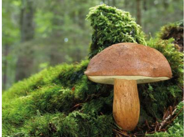
Abbildung 36: Maronen-Röhrling ( Imleria badia ).