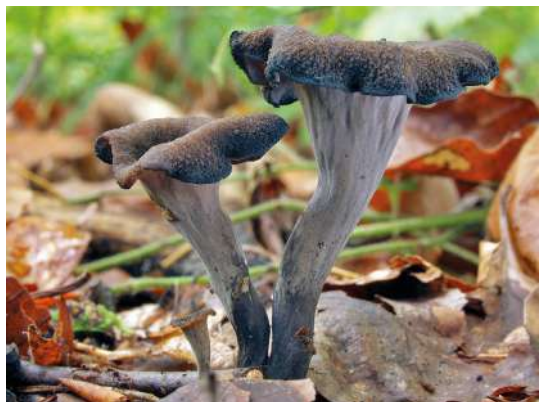
Abbildung 30: Totentrompete ( Craterellus cornucopioides ).

Die Totentrompete gehört in die Pfifferlingsverwandtschaft und kommt überwiegend in basenreichen Laubwäldern vor (Abbildung 30). Das Hymenophor ist bei dieser Art glatt. Der Hauptmykorrhizapartner ist die Rotbuche ( Fagus sylvatica ). Die Art ist weit verbreitet und in Baden-Württemberg häufig.