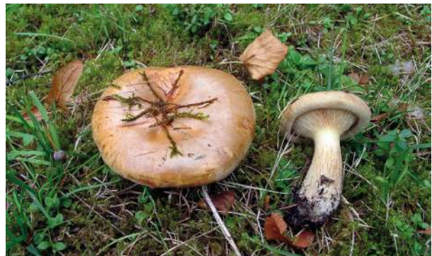
Abbildung 43: Kahler Krempling Abbildung 44: Kahler Krempling ( Paxillus involutus ).