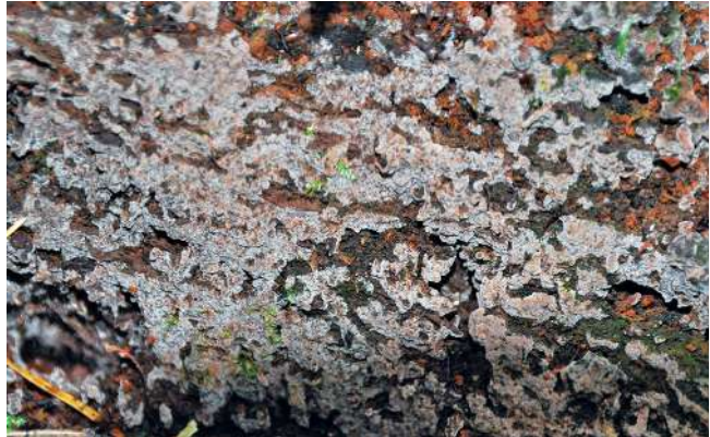
Abbildung 51: Tomentella sublilacina .