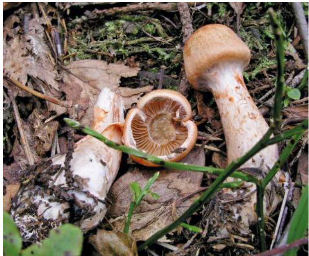
Abbildung 15: Geschmückter Gürtelfuß ( Cortinarius armillatus ).

Der Geschmückte Gürtelfuß (Abbildung 15) kommt in nährstoffarmen, bodensaureren Gebieten vor und ist an Birken ( Betula spp.) gebunden. In Baden-Württemberg ist er mäßig häufig.