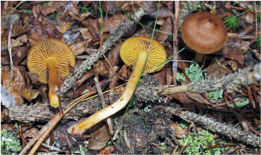
Abbildung 17: Safranblättriger Hautkopf ( Cortinarius croceus ).

Der Safranblättrige Hautkopf fällt durch seine olivbraune Hutfarbe und die im jungen Fruchtkörper schwefelgelben Lamellen auf (Abbildung 17). Die Art ist überwiegend in bodensauren, nährstoffarmen Nadelwäldern, selten auch bei Laubbäumen nachgewiesen und im Schwarzwald häufig.