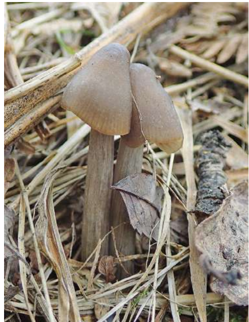
Abbildung 32: Frühlings-Giftrötling ( Entoloma vernum ).