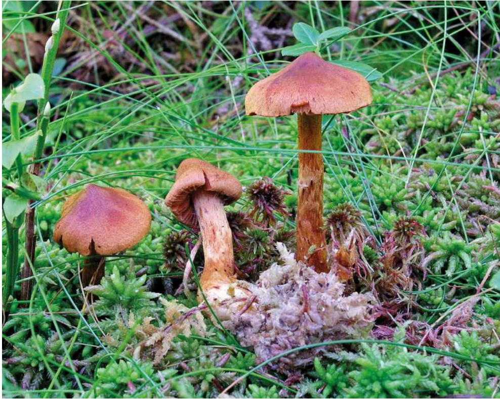
Abbildung 23: Spitzgebuckelter Raukopf ( Cortinarius rubellus ).

Der Spitzgebuckelte Raukopf ist ein obligater Begleiter verschiedener Nadelbäume (Abbildung 23). Die Art kommt in bodensauren, nährstoffarmen Nadelwäldern vor und ist in Baden-Württemberg häufig. Die sehr giftige Art gilt als Doppelgänger des Pfifferlings ( Cantharellus cibarius ).