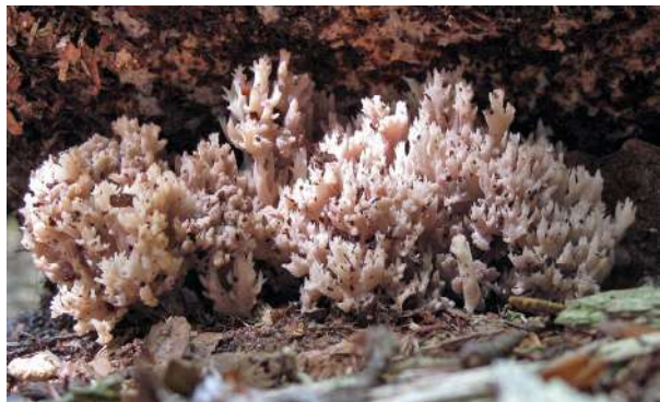
Abbildung 11: Kammförmige Koralle ( Clavulina coralloides ).

Die korallenförmigen Fruchtkörper sind bei der Kammförmigen Koralle an den Spitzen stark verzweigt (Abbildung 11). Die Art ist in Nadel- und Laubwäldern häufig. Lange wurden Vertreter der Gattung Clavulina als Streuabbauer klassifiziert, bis mit Hilfe genetischer Methoden gezeigt werden konnte, dass die Vertreter dieser Gruppe eine Ektomykorrhiza-Symbiose ausbilden (TEDERSOO & SMITH 2013). Grauschwarz verfärbte Fruchtkörper werden durch einen winzigen, parasitischen Schlauchpilz, Helminthosphaeria clavariarum (Desm.) Fuckel, verursacht.