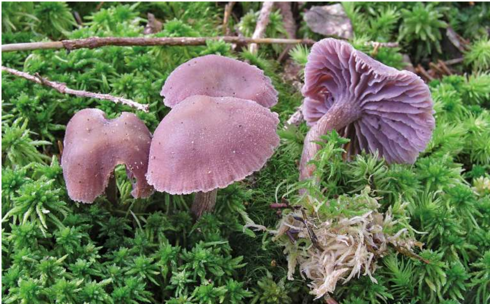
Abbildung 37: Violetter Lacktrichterling ( Laccaria amethystina ).

18.9.2013, K, 1000 m, T. Bernauer & M. Scholler / M. Scholler (KR-M-0037015); 2.10.2013, F, im Moos ( Sphagnum ), bei Picea abies , 940 m, B. Miggel (KR-M-0037296) (Abbildung 37); 12.9.2015, K, S-Ufer Wilder See, bei Castanea sativa , 915 m, M. Scholler (KR-M-0043688).