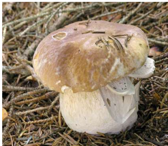
Abbildung 7: Gemeiner Steinpilz ( Boletus edulis ).