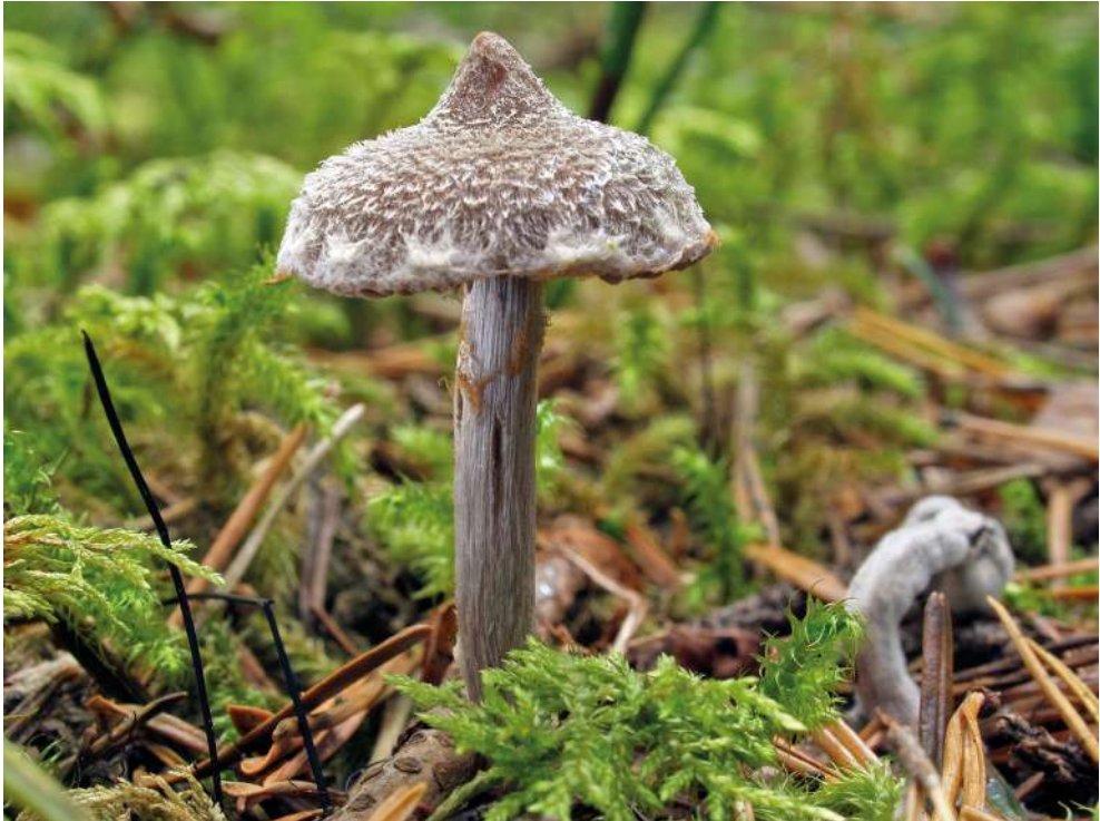
Abbildung 18: Duftender Gürtelfuß ( Cortinarius flexipes ).