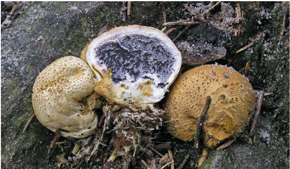
Abbildung 45: Dickschaliger Kartoffelbovist ( Scleroderma citrinum ).

Die Art ist Mykorrhizabildner von Laub- und Nadelbäumen auf sauren Böden. Kartoffelboviste sind nicht mit Bovisten verwandt, obwohl sie auch geschlossene Fruchtkörper bilden. Tatsächlich gehören sie in die Ordnung der Dickröhrlingsartigen (Boletales) (Abbildung 45).