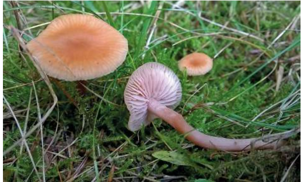
Abbildung 38: Zweifarbiger Lacktrichterling ( Laccaria bicolor ).

Der Name weist auf die Zweifarbigkeit dieser Art hin. Tatsächlich sind die Lamellen und das Basalmycel violett, während der Hut und der Stiel fleischfarben sind (Abbildung 38). Der Zweifarbige Lacktrichterling bildet überwiegend mit Nadelbäumen Symbiosen. Die Art ist nicht häufig.