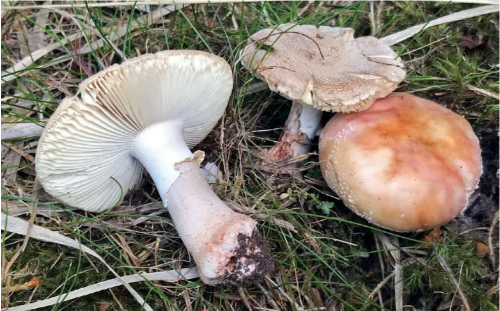
Abbildung 5: Perlpilz ( Amanita rubescens ).

3.7.2019, F, Erweiterungsgebiet, bei Abies alba , Picea abies , 990 m, M. Scholler (KR-M-0042741) (Abbildung 5).