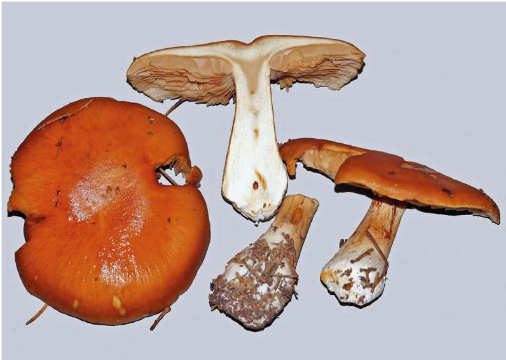
Abbildung 28: Cortinarius talimultiformis .

Molekulargenetische Untersuchungen wurden von der Sektion Multiformes der Untergattung Phlegmacium der Gattung Cortinarius von BRANDRUD et al. (2015) publiziert. Die Sektion Phlegmacium umfasst 10 einander sehr ähnliche, mittelgroße Arten, von denen 4 aus dem Schwarzwald bekannt sind. 6 der 10 Arten haben ihr Vorkommen in Nadelwäldern, bevorzugt auf sauren Standorten. Cortinarius talimultiformis zeichnet sich innerhalb dieser Gruppe durch einheitlich fuchsig-braune Fruchtkörper, fehlende Blautöne in den Lamellen, eine meist deutlicher gerandete Stielknolle als bei den Nachbararten (Abbildung 28) und etwas größere, mandelförmige Sporen aus. Allen Taxa gemeinsam sind ein mehr oder weniger markanter Geruch nach Kunstthonig, besonders an der Stielbasis, geringe Universalvelumreste, keine auffallenden, makrochemischen Reaktionen und relativ kleine, warzige, fast mandelförmige Sporen unter 10 µm Länge. Allerdings stehen sich diese Arten sehr nahe und überlappen teilweise in ihren Merkmalen, sodass im Zweifelsfall (so wie hier geschehen) die Sequenzierung zur Sicherung der Artdiagnose herangezogen werden sollte.