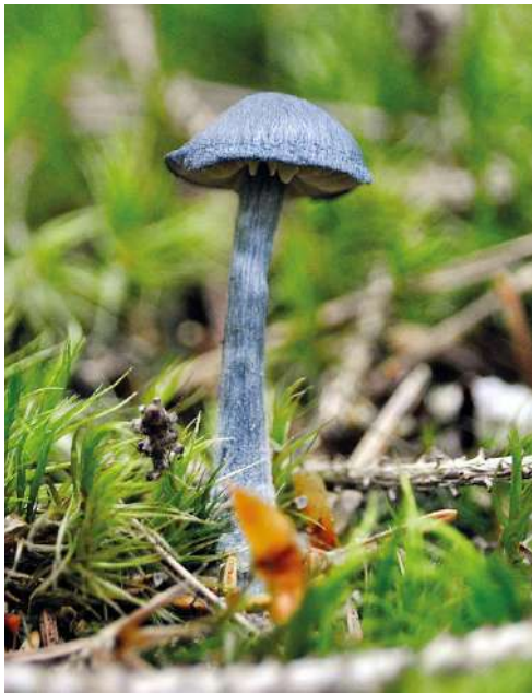
Abbildung 31: Stahlblauer Rötling ( Entocybe nitida ).

Der Frühlings-Giftrötling (Abbildung 32) ist eine zerstreut vorkommende Art in Baden-Württemberg. Im Frühjahr kommt sie in bodensauren Nadel- und Mischwäldern vor. Die Fruchtkörperform ähnelt einigen Arten der Gattung Mycena (Helmlinge), jedoch sind die Lamellen bei Sporenreife nicht weiß, sondern wirken durch die Sporenfarbe leicht rosa. Mikroskopisch lassen sich die Gattungen eindeutig unterscheiden.