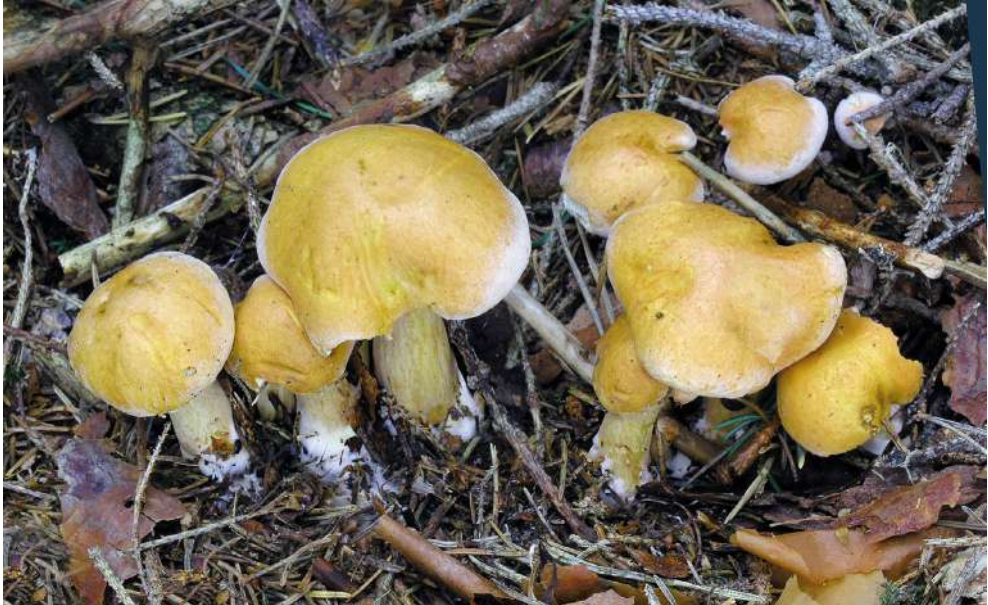
Abbildung 46: Kuh-Röhrling ( Suillus bovinus ).