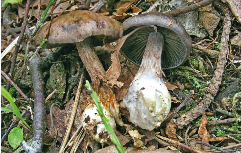
Abbildung 24: Grünvioletter Klumpfuß ( Cortinarius scaurus ).