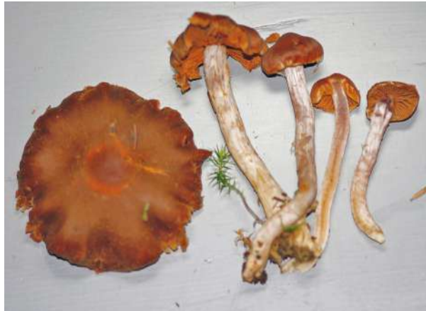
Abbildung 29: Gedrehter Gürtelfuß ( Cortinarius tortuosus ).

Der Gedrehte Gürtelfuß ist eine seltene Art bodensaure Nadelwälder (Abbildung 29) und in Baden-Württemberg bis auf wenige Funde nur im Schwarzwald verbreitet.