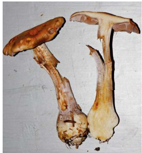
Abbildung 13: Glimmeriger Schleimkopf ( Cortinarius anomalochrascens ).

Der Glimmerige Schleimkopf ist eine an Nadelbäume gebundene Art der montanen Stufe. Sie gehört in die Sektion Riederi der Untergattung Phlegmacium (Schleimköpfe), deren Arten sich unter anderem durch eine Schleimschicht auf dem Hut auszeichnen. Die Art kommt vor allem im Südschwarzwald häufiger vor. Abbildung 13 zeigt den einzigen Nachweis von der Karwand, wo sie möglicherweise mit Fichte ( Picea abies ) in Symbiose lebt.