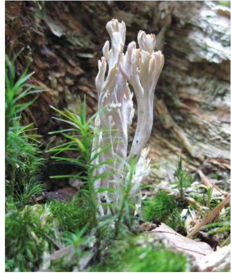
Abbildung 12: Runzeliger Keulenpilz ( Clavulina rugosa ).

Gleich der vorgenannten Art handelt es sich um einen häufigen Vertreter der Laub- und Nadelwälder. Im Gegensatz zur Kammförmigen Koralle sind die Spitzen weniger stark verzweigt (Abbildung 12).