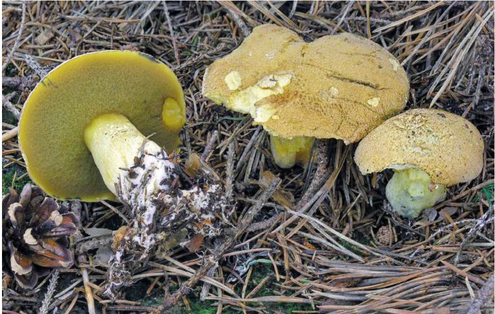
Abbildung 49: Sand-Röhrling ( Suillus variegatus (Sw.) Richon & Roze).

Der Sand-Röhrling kommt in bodensauren, nährstoffarmen Nadelwäldern vor und ist an Kiefern ( Pinus spp.) gebunden. Anders als der ähnliche Kuh-Röhrling ( S. bovinus , siehe oben) besitzt der Sand-Röhrling eine filzige Hutoberfläche (Abbildung 49).