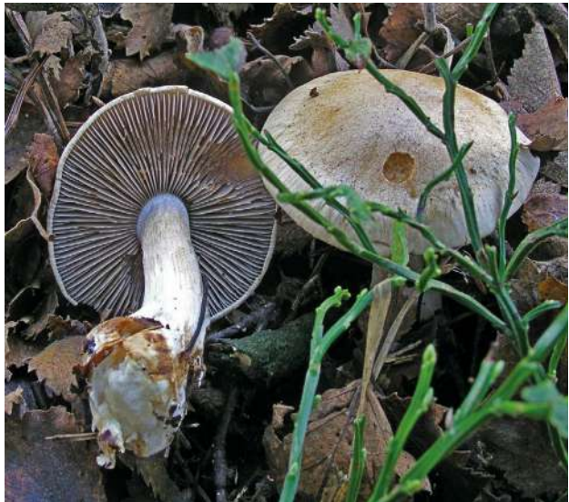
Abbildung 19: Zyanblättriger Klumpfuß ( Cortinarius fulvo-ochrascens ).

16.9.2014, G, bei Betula pubescens , Picea abies , Pinus mugo , 1040 m, B. Miggel & I. Süsser / B. Miggel (KR-M-0041452) (Abbildung 19).