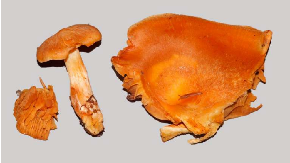
Abbildung 22: Aprikosenfarbener Schleimfuß ( Cortinarius lustrabilis ).

KRIEGLSTEINER & GMINDER (2010) berichten von von einem Fund dieser Art im Südschwarzwald aus einem Rauschbeeren-Spirken-Moorwald ( Vaccinio uliginosi-Pinetum rotundatae ) mit typischer Hochmoor-Vegetation und der Moorkiefer ( Pinus mugo var. rotundata ) als Mykorrhizapartner. Dieser Fund wird von LABER (2003) genauer beschrieben und abgebildet. Außer in Baden-Württemberg ist C. lustrabilis bisher aus Frankreich vom Haute-Savoie (Typus-Kollektion aus einem moosigen Fichtenwald auf 700 m Höhe, BIDAUD et al. 2000) und aus Norwegen und Finnland (NISKANEN et al. 2006) bekannt. Die Fundortangaben lassen auf ein Vorkommen auf sauren, trockenen bis anmoorigen Böden unter Abies alba (Weiß-Tanne), Picea abies (Fichte) bzw. Pinus spp. (Kiefer) schließen. An sich ist die kürzlich erst beschriebene Art gut charakterisiert und einzigartig in ihren Merkmalen: aprikosenfarbiger, hygrophaner Hut, relativ große, wenig warzige Sporen (8-10 x 5-6 µm) und ein fast milder Hutschleim. Da bisher noch kein deutscher Name vergeben wurde, schlagen wir für C. lustrabilis Aprikosenfarbener Schleimfuß vor.