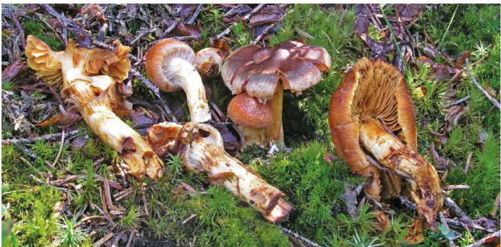
Abbildung 21: Löwengelber Raukopf ( Cortinarius limonius ).

Der Löwengelbe Raukopf ist eine obligat mit Nadelbäumen vergesellschaftete Art saurer, nährstoffarmer Nadelwälder. In einigen Gebieten Baden-Württembergs, wie dem Schwarzwald, ist die Art häufig.