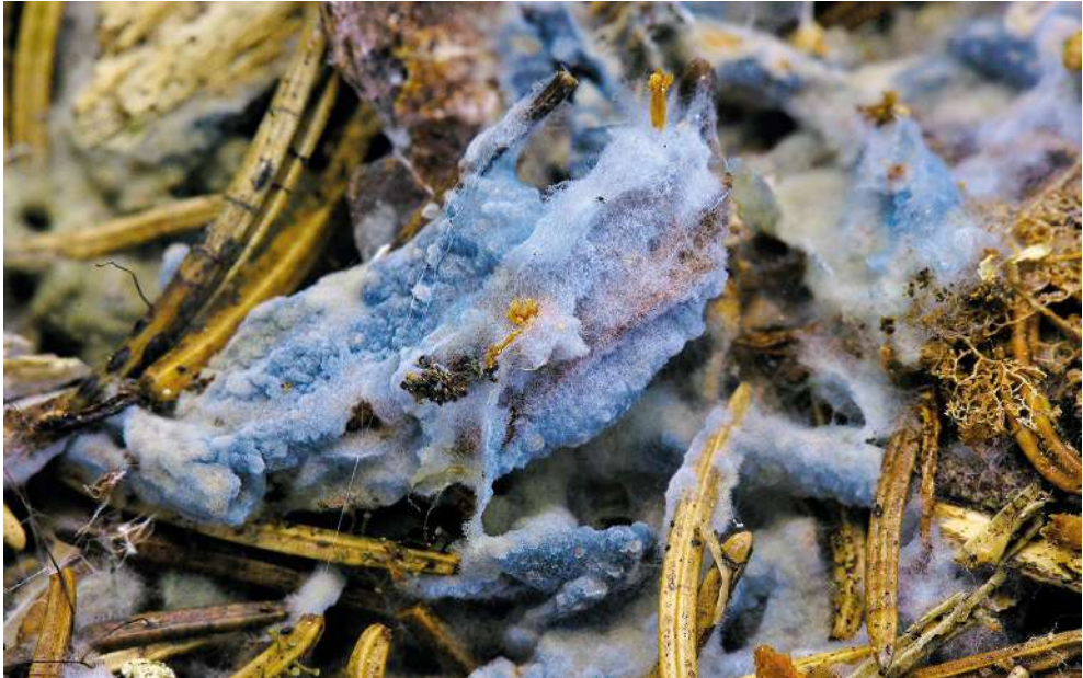
Abbildung 8: Schnallenloser Filzrindenpilz ( Byssocorticium caeruleum ).

Volkname wurde noch nicht vergeben. Wir möchten hier „Schnallenloser Filzrindenpilz“ vorschlagen. Mit welcher Baumart B. caeruleum eine Ektomykorrhizasymbiose bildet, bleibt offen, da sich der Fruchtkörper im Bereich dreier verschiedener Baumarten bildete. Die Arten der Gattung gelten als Naturnähezeiger und fallen alle durch ihre bläuliche bis grünliche Farbe auf. Die Fruchtkörper wachsen spinnwebartig in der Streuschicht, meist unter Totholzstrukturen. Sie sind nur mikroskopisch zu unterscheiden.