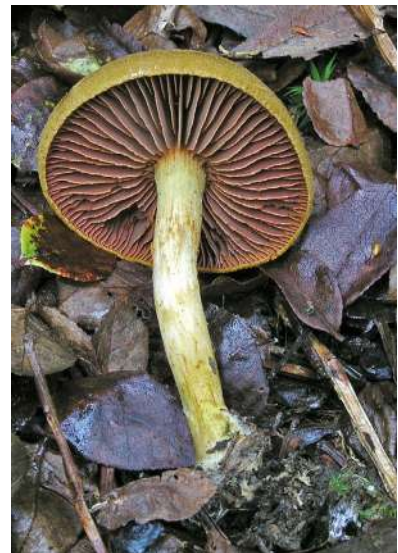
Abbildung 25: Blutblättriger Hautkopf ( Cortinarius semisanguineus ).

Der Blutblättrige Hautkopf ist gut an dem starken Kontrast seines gelbbraunen bis olivgelben Hutes und Stiels und den blutroten Lamellen zu erkennen (Abbildung 25). Die Art kommt in bodensauren, nährstoffarmen Wäldern vor und ist mit Nadelbäumen vergesellschaftet. Die Art ist in Baden-Württemberg weit verbreitet und häufig.