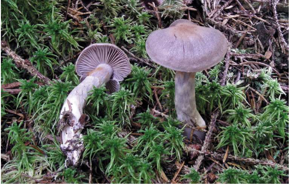
Abbildung 14: Braunvioletter Dickfuß ( Cortinarius anomalus ).

Der Braunviolette Dickfuß (Abbildung 14) ist morphologisch sehr variabel, vor allem die violetten Farbanteile können stark variieren. In Baden-Württemberg ist er eine weit verbreitete und häufige Art. Molekulargenetische Untersuchungen haben gezeigt, dass es sich um ein Aggregat von ca. 10 nah verwandten Arten mit ähnlichen Merkmalen handelt (DIMA et al. 2019).