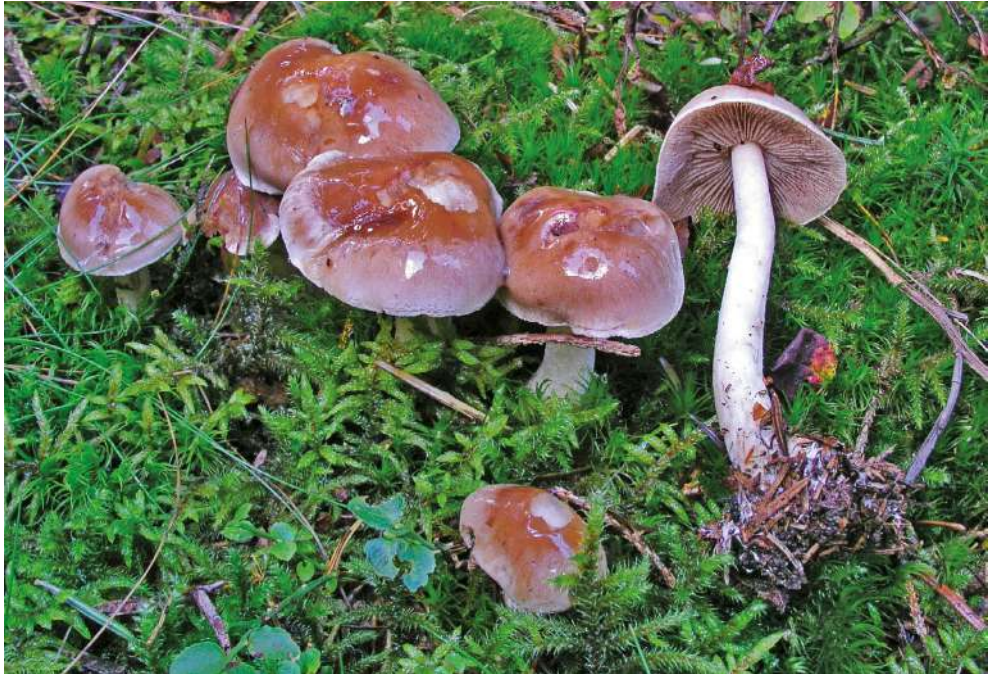
Abbildung 33: Langstieliger Fälbilling ( Hebeloma incarnatum ).