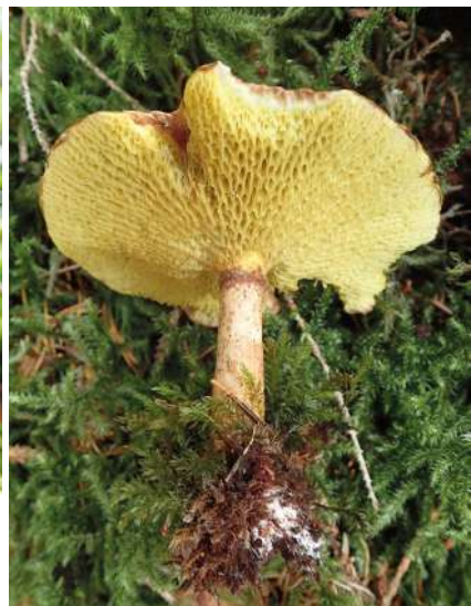
Abbildung 47, 48: Hohlfuß-Röhrling ( Suillus cavipes ).