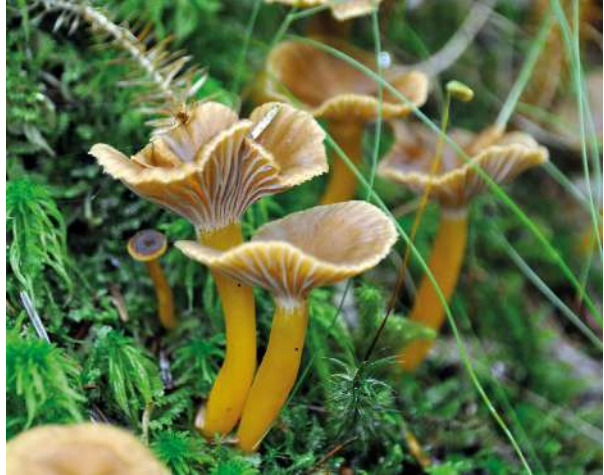
Abbildung 10: Trompetenpfifferling ( Cantharellus tubaeformis ).

Die Art kommt häufig in Nadel- und Laubwäldern mit vielen Fruchtkörpern vor. Wie auch der Echte Pfifferling ( Cantharellus cibarius ) besitzt der Trompetenpfifferling Leisten (Abbildung 10), unterscheidet sich makromorphologisch aber stark in Form und Farbe.