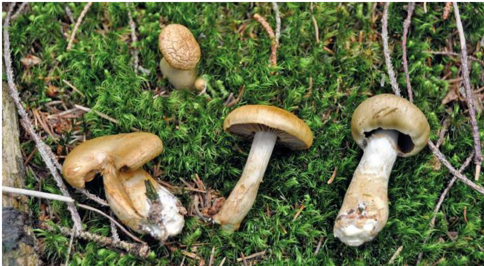
Abbildung 27: Der Weihrauch-Schleimkopf ( Cortinarius subtortus ).

18.8.2014, G, bei Abies alba , Pinus mugo , Picea abies , 1045 m, B. Miggel & I. Süsser / B. Miggel (KR-M-0041438); 11.10.2015, G, bei Betula pubescens , P. mugo , P. abies , 1040 m, B. Miggel & I. Süsser / B. Miggel (KR-M-0046622, KR-M-0046623).