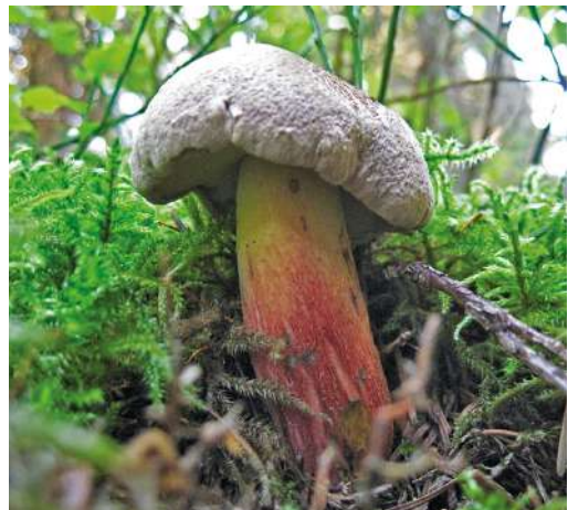
Abbildung 9: Schönfuß-Röhrling ( Caloboletus calopus ).

Der Schönfuß-Röhrling (Abbildung 9) ist durch den hellen Hut und den starken, gelbroten Farbverlauf mit hellem Netz am Stiel sehr auffällig. Bei Verletzung färben sich die entsprechenden Fruchtkörperteile sofort stark blau (siehe auch 43. Maronen-Röhrling). Caloboletus calopus bildet in Baden-Württemberg mit verschiedenen Laub- und Nadelgehölzen Ektomykorrhiza-Symbiosen, im Unter-