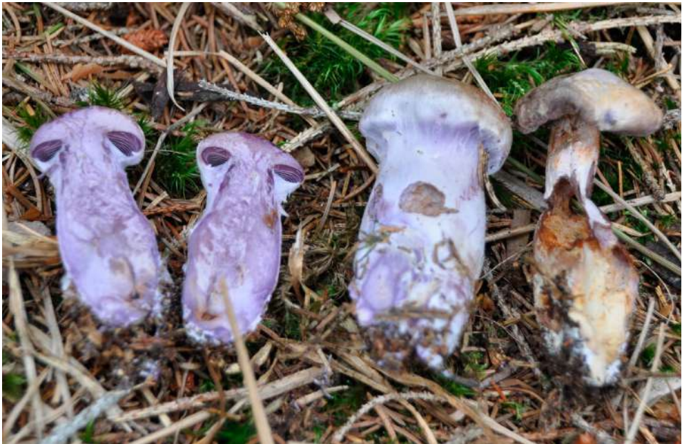
Abbildung 16: Bocks-Dickfuß ( Cortinarius camphoratus ).

18.8.2014, G, bei Betula pubescens , Abies alba , Pinus mugo , Picea abies , 1045 m, B. Miggel & I. Süsser / B. Miggel (KR-M-0041441); 16.9.2014, G, bei Betula pubescens , A. alba , P. abies , 1040 m, B. Miggel & I. Süsser / B. Miggel (KR-M-0041461).