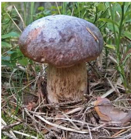
Abbildung 6: Gemeiner Steinpilz ( Boletus edulis ).

Der Gemeine Steinpilz ist auch dem Nicht-Pilzkenner als guter Speisepilz bekannt. Dennoch ist sein Aussehen sehr variabel, dokumentiert auch durch die beiden Aufnahmen vom Wilden See (Abbildungen 6, 7). Weitere verwandte Dickfußröhrlinge im Untersuchungsgebiet sind der Schönfuß-Röhrling ( Caloboletus calopus ) und der Flockenstielige Hexenröhrling ( Neoboletus erythropus ). Interessanterweise stammen alle von einem kleinen Areal nordöstlich des Sees mit reichlich Trittschäden.