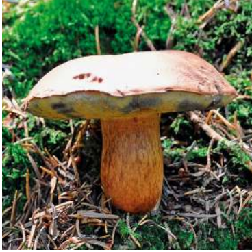
Abbildung 35: Maronen-Röhrling ( Imleria badia ).

körper akkumulieren, vor allem in der Huthaut. Die Blaufärbung, die bei dieser und zahlreichen weiteren Arten der Röhrlingsverwandtschaft typischerweise nach Verletzung auftritt, ist auf Pulvinsäurederivate zurückzuführen. Diese reagieren mit Sauerstoff und verursachen die blaue Verfärbung (Abbildung 35, siehe Hutunterseite).