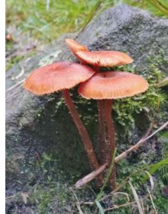
Abbildung 40: Braunstieler Lacktrichterling ( Laccaria proxima ).

Der Braunstieler Lacktrichterling kommt in bodensauren Nadel- und Mischwäldern vor, nicht selten zusammen mit dem Zweifarbigem Lacktrichterling. Vom ähnlichen Rötlichen Lacktrichterling unterscheidet sich die Art durch den gerillten und etwas längeren Stiel (Abbildung 40).