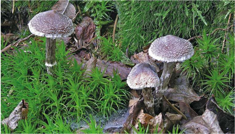
Abbildung 20: Weißflockiger Gürtelfuß ( Cortinarius hemitrichus ).