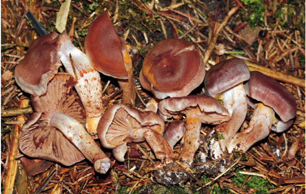
Abbildung 26: Kupferschuppiger Dickfuß ( Cortinarius spilomeus ).

Die Art kommt in Baden-Württemberg nur zerstreut in Nadelwäldern vor.