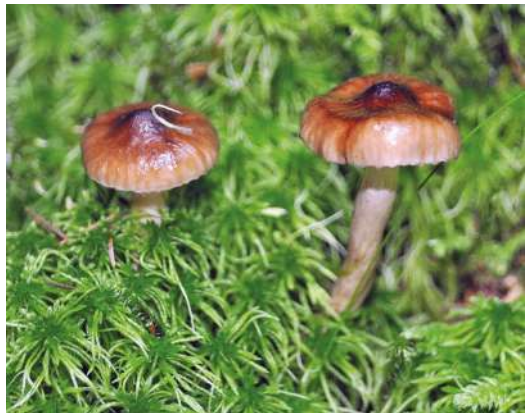
Abbildung 34: Olivbrauner Schneckling ( Hygrophorus olivaceoalbus ).

Der Olivbraune Schneckling (Abbildung 34) besitzt, wie die meisten anderen Arten der Gattung, eine feucht-schmierige Hutoberfläche, daher der Gattungsname. Der Olivbraune Schneckling ist an Fichte ( Picea abies ) gebunden. Insgesamt ist die Art im Schwarzwald häufig, besonders in höheren Lagen.