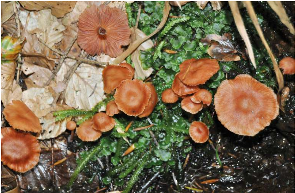
Abbildung 39: Rötlicher Lacktrichterling ( Laccaria laccata ).

18.9.2013, F, 925 m, M. Scholler & T. Bernauer / M. Scholler (KR-M-0037010); 7.10.2013, K, 955 m, R. Schneider (KR-M-0038172).