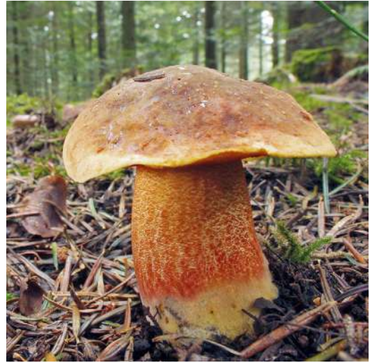
Abbildung 42: Flockenstieliger Hexenröhrling ( Neoboletus erythropus ).

Der Flockenstielige Hexenröhrling (Abbildung 42) kommt sowohl bei Nadel- als auch bei Laubbäumen vor. Er ist häufig. Wie der Maronen-Röhrling bläut auch diese Art bei Verletzung des Fruchtkörpers. Die Art fruktifiziert schon im Frühsommer.